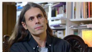
Aurélien Barrau Astrophysicien, Université de Grenoble