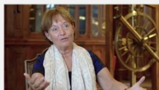
Sylvie Vauclair Astrophysicienne, Université de Toulouse