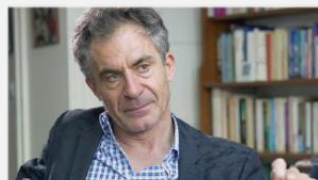
Etienne Klein Physicien et philosophe des sciences, CEA, Paris