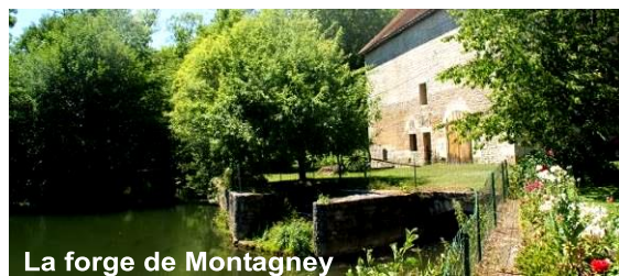
La forge de Montagney

un canal, le haut-fourneau, une partie de la halle à charbon et divers autres bâtiments.