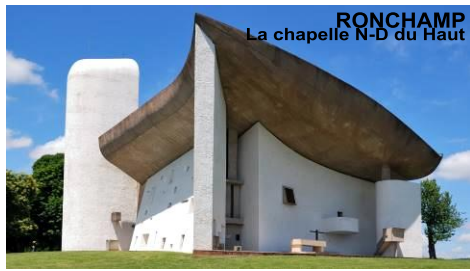
RONCHAMP La chapelle N-D du Haut

L'œuvre de Le Corbusier classée au patrimoine de l'UNESCO