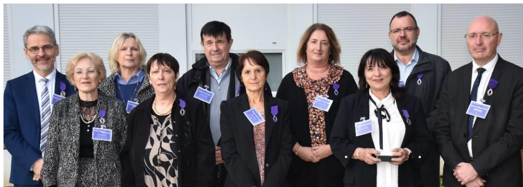
Les nouveaux décorés que la section a la joie d'accueillir (De Gauche à Droite) :