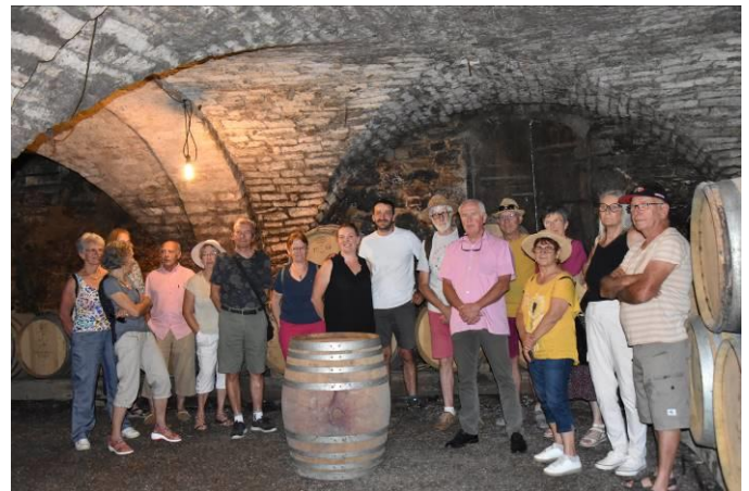
Dans les caves Cheviet à Bucey-lès-Gy